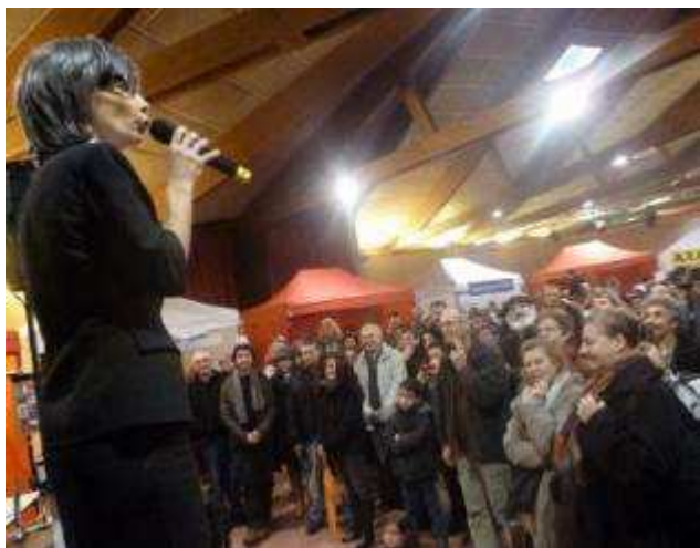
Accueillis par «l'adjointe aux associations»

Pas de doute possible : les onze (oui, ils ne sont que onze) comédiens de l'Utopium théâtre connaissent sur le bout des doigts le monde des associations et ils n'ont qu'à piocher dans ce riche matériau pour servir, un faux «forum des assos», à peine plus caricaturé que le vrai. Le public, qui est venu nombreux au centre culturel du Bois de Castres, jubile dès l'entrée, accueilli par l'adjointe aux associations en tailleur, bousculé par Jacques le bénévole qui cherche Étienne, Claire et le rouleau de scotch. A l'intérieur, des stands improbables comme celui des collectionneurs de bocaux d'air, ou de clous de la clouterie Verneuil, d'autres qui se suffiraient presque à eux-mêmes : l'association des parents d'élèves, des habitants du quartier du coin, des restaurateurs de cabines téléphoniques.