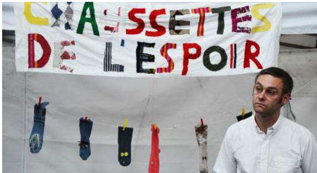
Les Chaussettes de l'espoir, une des nombreuses fausses associations du spectacle.

Pour l'avant-dernier spectacle de la saison, le Boulon a gratifié ses fidèles visiteurs d'une représentation d'un genre particulier, puisqu'il s'agissait d'un simulacre de forum associatif dans lequel étaient évoqués certains problèmes, bien réels quant à eux.